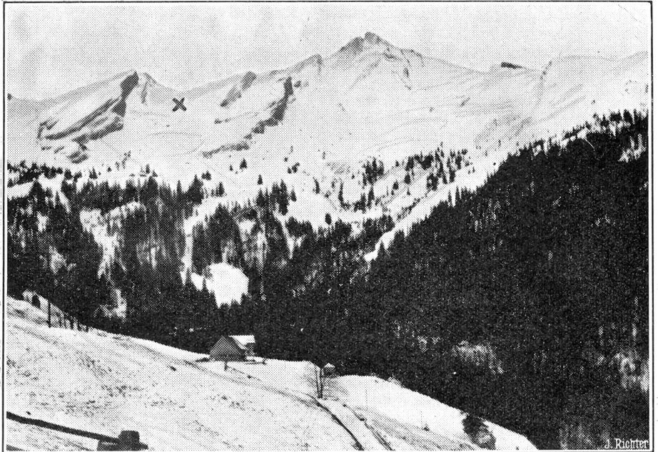
Zum grossen Bergunglück am Brisen. 7 Skifahrer in einer Lawine umgekommen. Wir zeigen hier eine neuste Ansicht des Brisen-Massives, wo sich das schreckliche Lawinenunglück ereignete. Die Stelle, wo die Skifahrer verschüttet wurden, ist mit (X) bezeichnet.

Die Mitglieder des Verwaltungsrates der Schweizerischen Unfallversicherungsanstalt in Luzern wurden alle wieder bestätigt, nur an Stelle des gewesenen Sekretär-Kassiers Brunner vom schweizerischen Uhrenarbeiterverband wurde neu als Vertreter der Obligatorisch-Versicherten