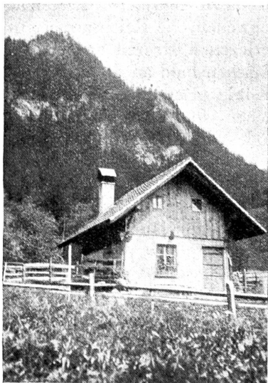
Das „Gsäb“, der Felskopf mit den vorgeschichtlichen Höhlen.