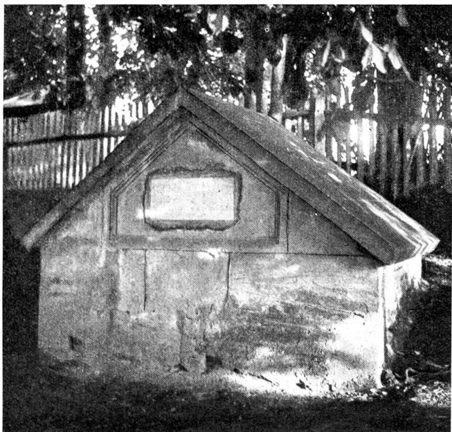
Das Grab auf „Monrepos.“

Auf der baumbestandenen Höhe des Weissensteins beim Steinhölzli zu Bern steht ein einsamer Gartenpavillon, dessen Fensterladen stets verschlossen bleiben. Man wollte wissen, dass sich hier zuweilen der Geist des in fremden Kriegsdiensten berühmt gewordenen, in seiner Vaterstadt verstorbenen und nebenan auf der Anhöhe des Monrepos begrabenen Generals Lentulus, weiland Landvogt von Köniz, aufhalte. Nur in Zeiten der Landesgefahr dürfe man ihn beschwören und ihn, der auf manchem Schlachtfeld die Geschicke Europas mitentscheiden geholfen hatte, um Rat fragen. In ihren «Gespenstergeschichten aus Bern» erzählt Hedwig Correvon, dass während des Weltkrieges einige beherzte Männer hingegangen seien, um den General zu befragen. Nachdem sie feierlich um das kleine Haus Aufstellung genommen, habe einer wiederholt gerufen: «General Lentulus, General Lentulus!» Nichts rührte sich, so dass man schon enttäuscht abziehen wollte, da hörte man von innen ein Gähnen,