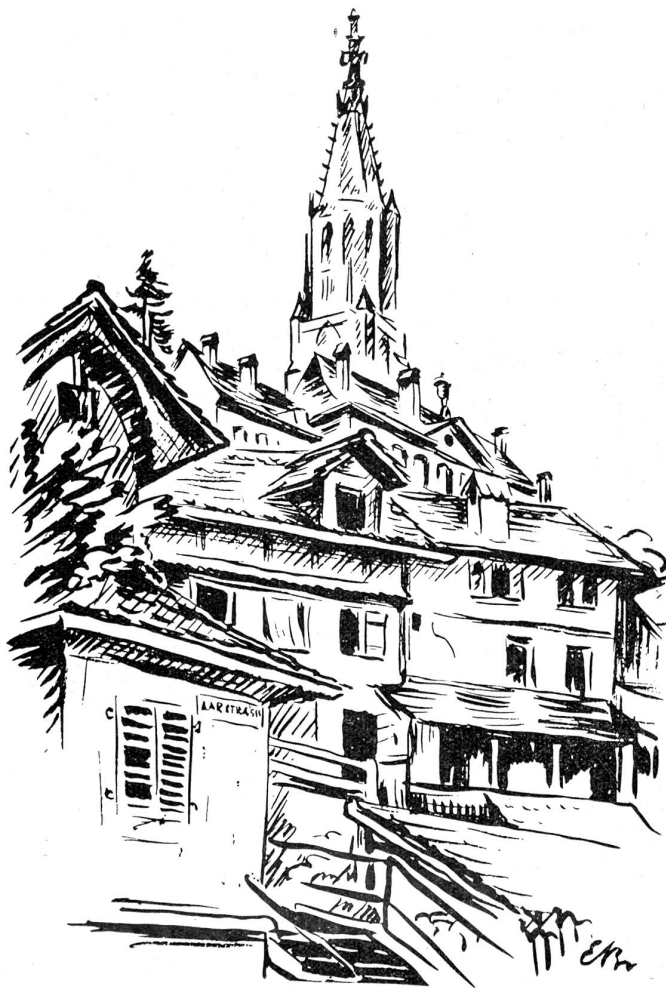
Aufgang zur Fricktreppe zum Münsterplatz.

Nun aber zurück zur Stadtbesichtigung. Ueberqueren wir den Bärenplatz in südlicher Richtung, so gelangen wir zum Bundesplatz und den ausgedehnten Verwaltungen der Eidgenossenschaft, dem Bundeshaus und Parlament. Der Mittelbau mit dem Nationalratssaal und den andern Sitzungszimmern unserer Regierung, stellt einen recht repräsentablen Bau, aber ohne einheitlichen Stil, dar. Die Besucher werden unentgeltlich durch die Räumlichkeiten geführt und erhalten so Gelegenheit, neben andern zwei gewaltige Wandbilder zu sehen: das eine, von Giron, den Vierwaldstättersee darstellend, das andere, von Welki und Balmer, „Die Landsgemeinde“. Der Besucher des Bundeshauses sollte nicht veräumen, von der Bundesterrasse aus einen Blick auf das Aaretal und die Berner Alpen zu werfen, sofern die letzteren