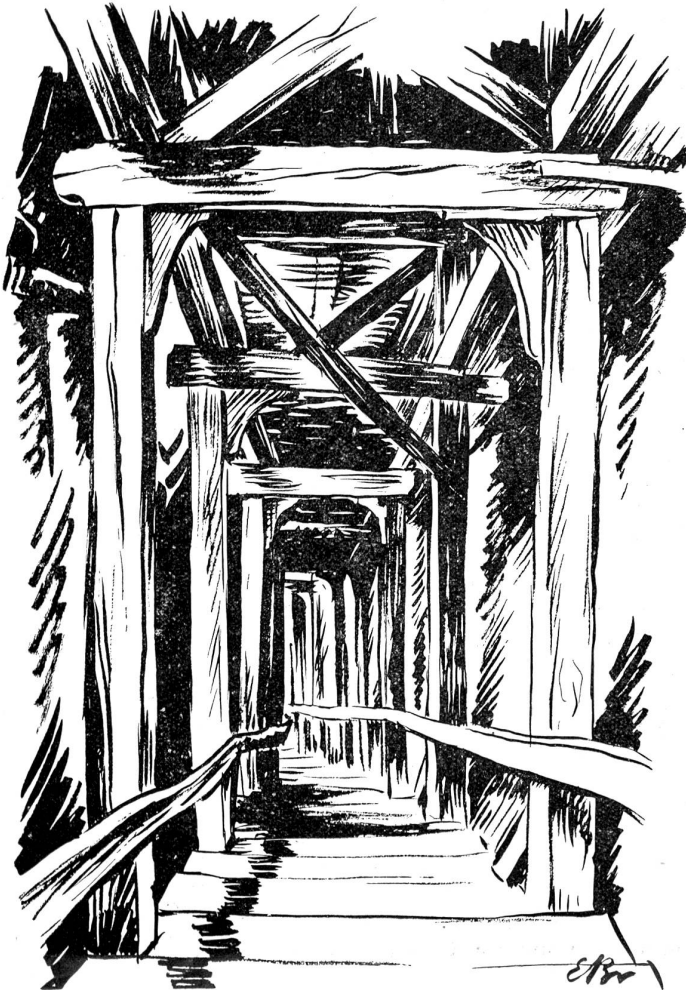
Fricktreppe. Eine der interessantesten Treppen, welche die Matte mit der höher gelegenen Stadt verbindet.

Schilderung verblaßt gegen das persönliche Erlebnis und es ist etwas ganz Gewaltiges, was hier an Kunst und Handwerk geleistet wurde. In einem Führer durch Bern aus dem Jahre 1913 lesen wir von Dr. A. Zesiger und C. A. Voosli unter anderm Folgendes über das Münster: „Ein Bauwerk, an dem so viele Jahrhunderte gebaut haben, ist wie ein großes, offenes Buch. Jedermann kann darin lesen; abgeschreckt von der Größe, unterlassen es die meisten. Wie geheimnisvoll mutet es nicht an, die schaffende Hand überall zu erkennen, wie sie hier sich in einem alten Gefühl, dort in einem kunstreichen Steinbild, einer Grabplatte, wieder anderswo im Wappen einer Stuhllehne oder in einer farbigen Glasplatte verewigt sind ....“ usw. Die Plattform, die den schweren Münsterbau gegen die Aareseite hin stützt, weist auch eine Bauzeit von zwei Jahrhunderten auf. Am 25. November 1694 hat sich der Theologe Weinzäppli auf einem Pferd über die Plattformmauer in das darunter liegende Mattequartier gestürzt, ohne sich weiter zu verletzen. Eine Gedenktafel an der Absturzstelle erinnert an die merkwürdige Begebenheit.