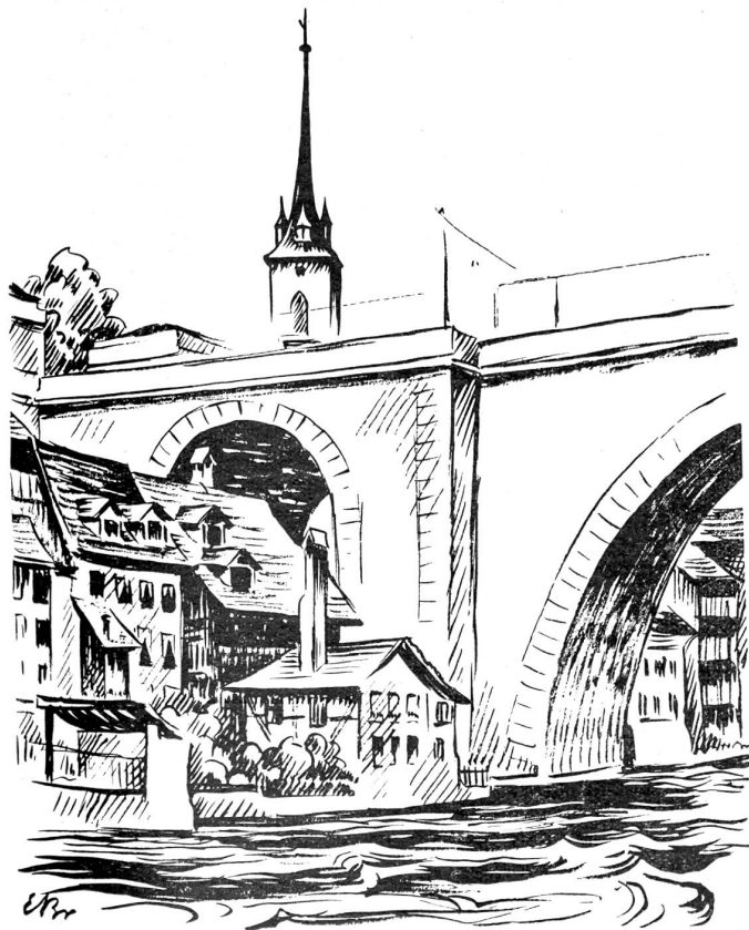
Nydeckbrücke und Häuser an der Matte.

Und nun zum schönsten Bau des historischen Bern, dem Münster, auf der Südseite der Aarehalbinsel. Wir wollen unsere Gäste nicht mit Daten und Namen aller derer, die sich um das Gelingen dieses mächtigen, 100 Meter hohen gotischen Baues verdient gemacht haben, unterhalten und bemerken nur, daß 1421 die Grundsteinlegung erfolgte und die Bauzeit sich auf über zwei Jahrhunderte erstreckte. Jede