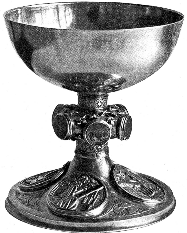
Zwinglibecher, den Zwingli verwendete, als er Geistlicher in Glarus war.

Erwähnen wir noch einen Metallleuchter flämischer Arbeit aus der zweiten Hälfte des 15. Jahrhunderts, der gleichfalls der Burgunderbeute zugeschrieben wird.