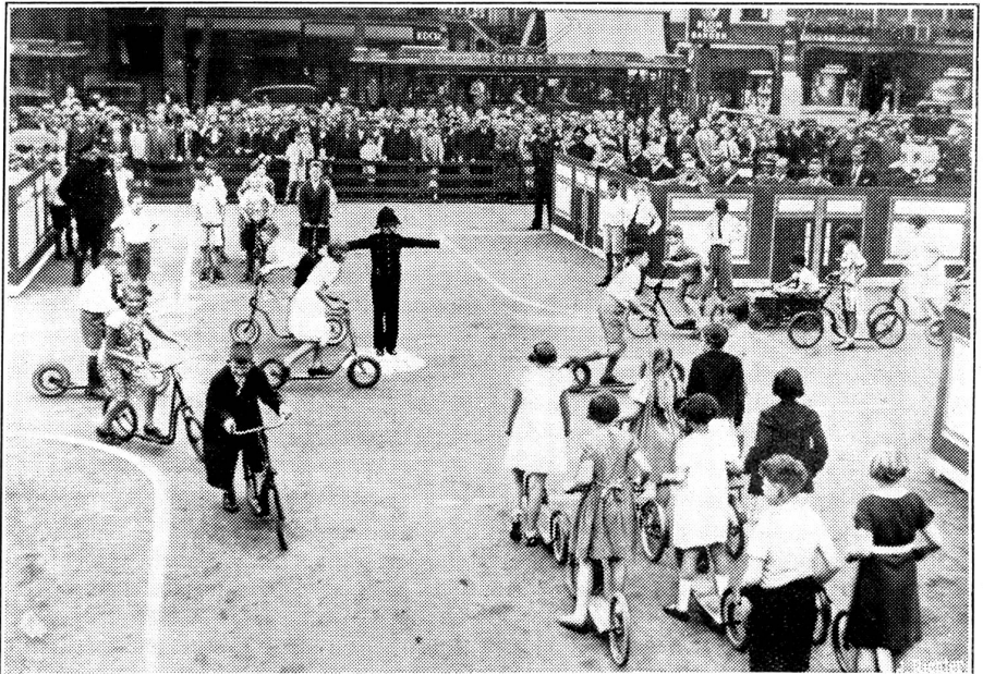
Der jüngste Polizist der Welt regelt den Verkehr in der Kinderstadt.

Man kann heute sagen, daß Frankreich größte Eile habe. Seit der deutsche Reichsfinanzminister und Wirtschaftsdiktator Schacht den Osten bereist hat und in Belgrad und Sofia nicht nur gegessen und getrunken, sondern weitgehende wirtschaftliche Unterhandlungen angebahnt, schaut man in Paris besorgter als vorher auf Jugoslawien, den schwachen Punkt in der Kleinen Entente und im Balkanbund. Die entschlossene Stellungnahme Frankreichs soll gerade diesen Punkt stützen. Es geht übrigens durchaus nicht nur um die Habsburger, es geht um die wirtschaftlichen Belange: Jugoslawien scheint unter den Sanktionen mehr als viele andere Staaten gelitten zu haben; wie die Neutralen, nahm es die Völkerbundsbeschlüsse ernster als etwa das Lavalische Frankreich. Das Dritte Reich verspricht nun in Belgrad als Groß-Abnehmer Heilung aller Wunden, auch der Sanktionswunden, die Jugoslawien um des himärischen