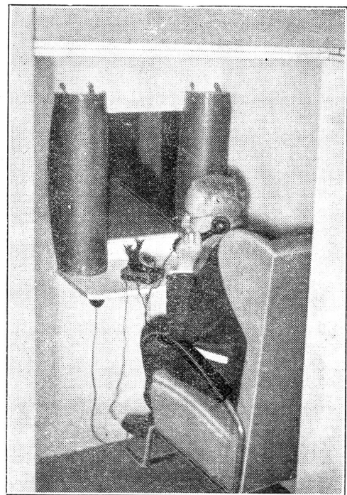
Die erste Fernseh-Sprechleitung der Welt zwischen Berlin und Leipzig eröffnet.

Während beim sogenannten „Zwischenfilmverfahren“ zwischen Aufnahme und Wiedergabe etwa 1 bis 3 Minuten verstreichen, gibt es neuerdings auch Fernsehsysteme, die ein gleichzeitiges Fernsehen ohne jeden Zeitverlust ermöglichen. Im Ausland wird die neue Technik mächtig gefördert, namentlich in England, in U. S. A. und in Deutschland. Warum wartet die Schweiz? Unsere brachliegende Industrie hat doch neue Artikel und Belebung so nötig.