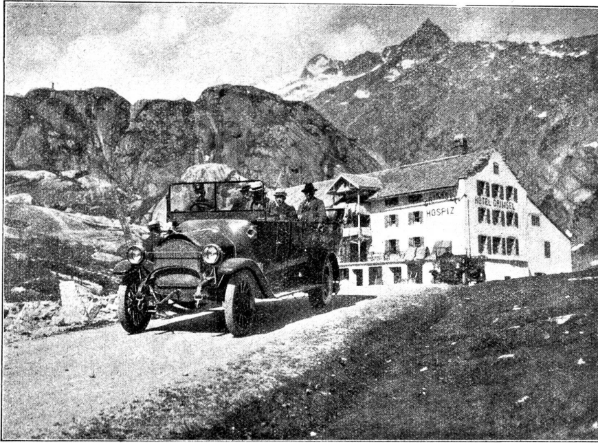
Das alte Grimsel-Hospiz.

weder Ihre Verhältnisse noch ihre Verwandtschaft, und was man so hört, klingt nicht gerade vertrauensvoll.“