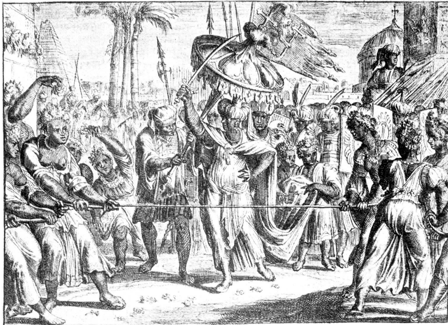
Der „falsche Jakob von Abessinien“ haut den seidenen Strang entzwei.

Nach diesem war dem Könige nichts mehr angelegen als wie er den falschen Jakob in seine Hände bringen möchte, der hatte sich aber weit ins Gebürge verflochten, und konnte daselbst, ungeachtet alles Fleißes nicht aufgemacht werden. Denn er hatte all sein Volk von sich gelassen und nur vier Diener und etliche Geißen bei sich behalten, mit deren Milch er sich und seine Gefährten zu ernähren gedachte. Weil nun der Winter vor der Thür (zu wissen, daß der Winter in Habessinien im Mittel des Juni anfängt, und drei Monat lang währet, aber anders nicht als mit grausamen Regen- und Wassergüssen, davon sich der Nilus in Aegypten mitten im Sommer aufschwellet und ergießet), so begab sich der König mit seinem Kriegs-Heer wieder zurück in die Landschaft Dembea, und überließ dem Unter-Könige in Tigre die Sorge, den erdichteten König aus seinen Schlupflöchern zu loden, und in seine Gewalt zu bekommen. Letzterer hatte unterdessen etwa sechshundert Mann wieder an sich gezogen und sich damit in das Gebürge Bora begeben. Daselbst wohnten zween vornehme von Adel, die des gebliebenen Königs Jacobi Bluts Freunde von seiten seiner Mutter waren, und dem Betrieger anfangs geglaubet, auch Beistand versprochen hatten.