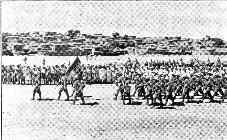
Die Italiener, mit flatternder Fahne an der Spitze, ziehen in Makalle ein.

sonders gebildete „mongolische Truppe“ besetzt die wichtigsten Distrikte der Provinz Tschahar und wird wahrscheinlich auch Kalgan in ihren Aktionskreis einbeziehen. Im nördlichen Hopei haben die „unabhängigen Bauernkomitees“ vorgearbeitet, und die Gegenwehr ist durch den Abmarsch der Chinesen zum voraus gebrochen. Im südlichen Hopei und in Schantung sollen offenbar die gefausten Generäle das Ihrige tun, um der neuen Vasallenregierung das Land auszuliefern. Schantung, Hopei und Tschahar — das also wird der Kern des neuen Staates sein — das volkreichste Gebiet des Reiches zu beiden Seiten des untern Hoangho. Was man später noch hinzuerobert würde, fällt in zweite Linie: Die hinter Hopei liegenden Berggebiete von Schansi und Schensi, die Meerprovinz Kiangsu, vielleicht auch Honan.