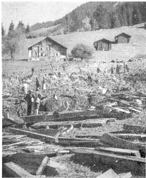
Ein Bauernhaus vom Unwetter zertrümmert.

Wie wir in der letzten Nummer berichteten, riss ein durch das Unwetter verursachter Erdbeben unweit Saanen (bei Rougemont) ein Bauernhaus mit, wobei drei Menschen ums Leben kamen. Unser Bild zeigt die Trümmerstätte.