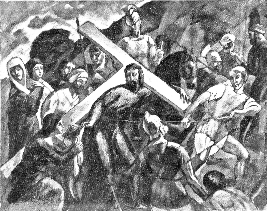
E. Linck: Die Kreuztragung Christi. (In Privatbesitz.)