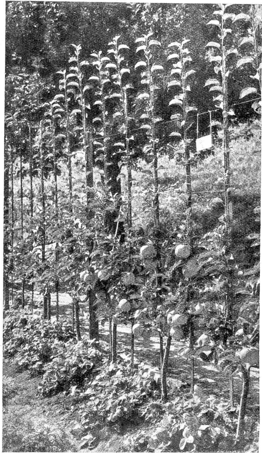
Vierjährige U-Formen des Ontario-Apfels reich mit Früchten beladen, an einem freien Spalier im Nutzgarten der Gartenbauschule Brienz.

Es ist ein selbstgeschaffenes Reich oberher dem Dorfe mit schöner Berg- und Seeanblick. Einheimische und auswärtige Besucher staunen, was fühner Unternehmungsgeist