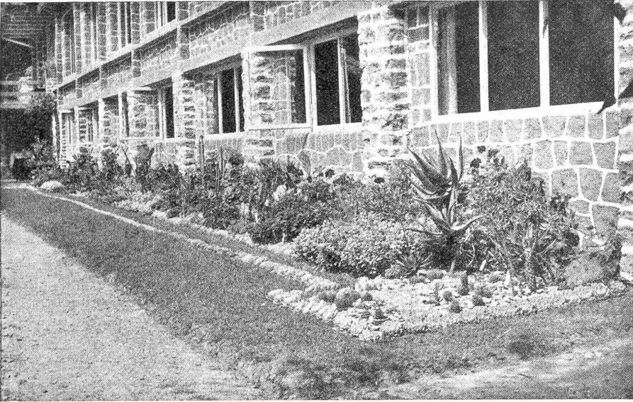
Blütenrabatte mit längst vergessenen Blatt- und Blütenpflanzen, in Verbindung mit Kakteen und Sukkulenten, auf der Südseite des Parkhauses der Gärnerinnen-Lehranstalt Brienz.

Manizucht selig werden. Weil sich aber dieser Glaube als ein Wahn erweist, so werfen wir unseren Zorn auf die Regierung, die doch Geld genug hätte, allen Bedürftigen zu helfen, wenn sie nur wollte.