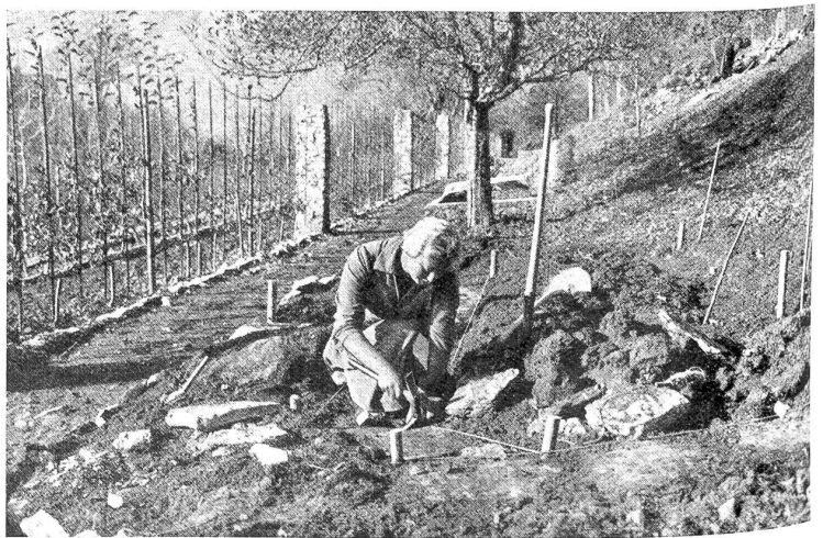
Werktätige Uebung beim Legen von Plattenwegen. Der neue Gewürzgarten wird angelegt.

Es ging aber auch etwas Mütterliches, Starkes von dieser Frau aus, die gleichsam die Seele auf der Alp und die vorbildlichste unter allen Arbeitskräften war. Nie sah man sie untätig und auch nie mißmutig, obschon ihr das