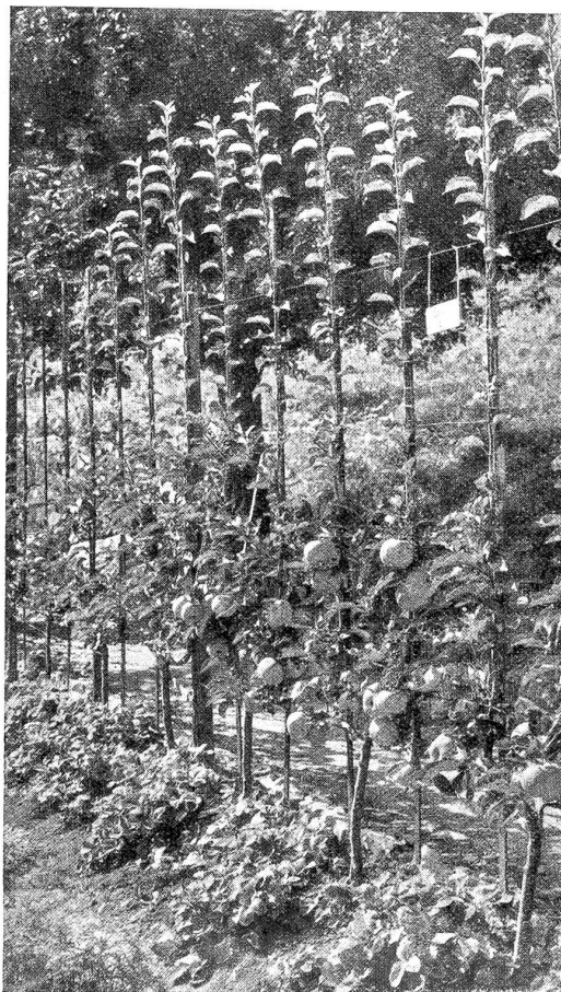
Vierjährige U-Formen des Ontario-Apfels reich mit Früchten beladen, an einem freien Spalier im Nutzgarten der Gartenbauschule Brienz.

Es ist ein selbstgeschaffenes Reich oberher dem Dorfe mit schöner Berg- und Seeanblick. Einheimische und auswärtige Besucher staunen, was fühner Unternehmungsgeist