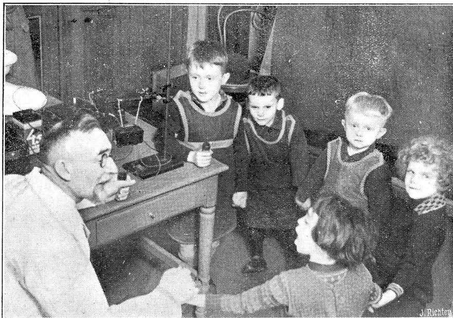
Hörunterricht für Taubstumme mittels Fern tastens.

Nebenstehendes Bild zeigt den Unterricht in der Taubstummenanstalt. Der Lehrer, mit dem positiven Kontakt in der linken Hand, schließt die Kette, die von den Kindern untereinander gebildet wurde, um das Fern tasten gleichzeitig mehreren Personen zu ermöglichen. Der Lehrer spricht mit normaler Sprache in das Mikrophon. Vor dem Unterricht müssen die Hände der Kinder mit Wasser angefeuchtet werden, um für die Stromschwingungen einen besseren Kontakt herzustellen.