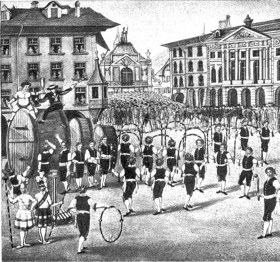
Küfertanz am Ostermontag im Alten Bern.