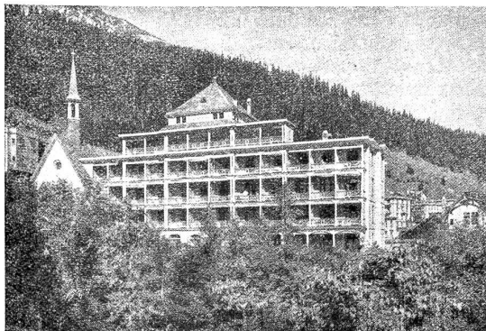
„Alexanderhaus“ in Davos.

Das Diakonissenhaus in Bern hat kürzlich als Schenkung das sogenannte „Alexanderhaus“ in Davos über-