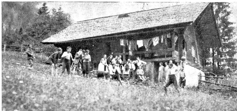
Das Ferienheim der Radiokameraden im Kiental, wo es in den Ferienwochen sehr lustig zugeht.

Letztes Jahr bauten und schenkten sie einem armen Bergtal ein Elektrizitätswerk und alle Installationen.