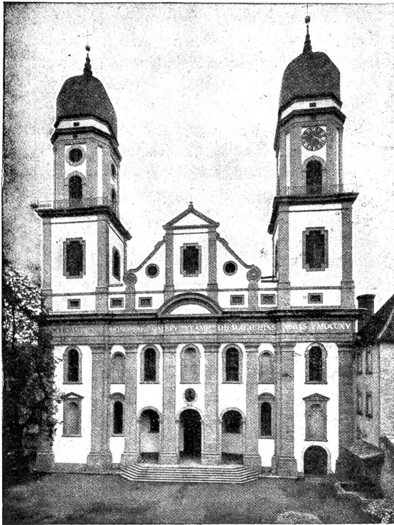
Die Kirchenfassade des ehemaligen Klosters St. Urban.

Die frühere Klosterkirche ließ der Abt Malachias Gluk (1706—1726) abreißen und an ihrer Stelle den heutigen Bau ausführen, was sich bis ins Jahr 1725 hineinzog. Um dieselbe Zeit wurde auch der Chor mit der kunstvollen Bestuhlung geschmückt, welche bei der Säkularisierung des Klosters durch die Regierung um einen wahren Schlemmerpreis