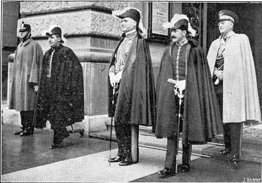
Neujahrsempfang im Bundeshaus.

Traditionsgemäss fanden sich auch dieses Neujahr die diplomatischen Vertreter der Auslandsmächte am Neujahrsmorgen im Bundeshaus ein, um dem neuen Bundespräsidenten Minger ihre Neujahrsglückwünsche persönlich zu überbringen. Der Einzug der Diplomaten in bunter Amstracht bot wiederum das gewohnte, prächtige Bild. Unser Bild zeigt die Vertreter Italiens beim Verlassen des Bundeshauses.