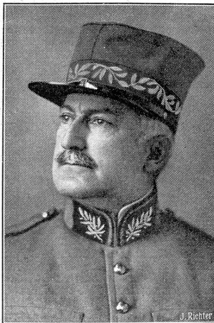
† Oberstdivisionär Alfons Schué, Bern.

Die Betriebseinnahmen der S. B. B. im 1.—3. Quartal betragen approximativ Fr. 251,674,000, wovon Fr. 103,792,880 auf den Personenverkehr und Fr. 139,884,950 auf den Gepäc-, Tier-, Güter- und Postverkehr fallen. Die Netto-Betriebsausgaben beliefen sich in der gleichen Zeit auf Fr. 180,111,600. Die Schiffahrt auf dem Bodensee brachte in den ersten 3 Semestern des Jahres einen approximativen Ueberschuss der Betriebsausgaben von Fr. 116,570. Im 3. Quartal beförderten die S. B. B. 27,971,000 Reisende und 3,889,000 Tonnen Güter.