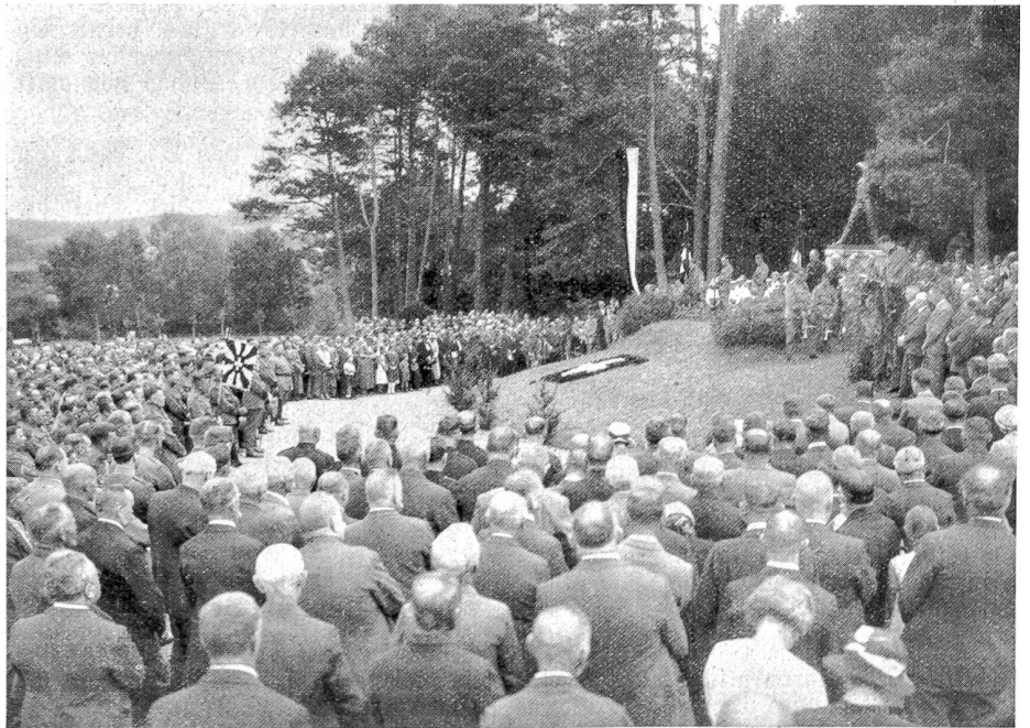
Erinnerungsfeier des Schützenbataillons 3 an die Mobilisation von 1914 beim Soldatendenkmal in Lyss.

Auf dem Genfersee wurde das erste durch Elektrizität angetriebene Schiff, die „Genève“, in Verkehr gesetzt. Dank seiner Dieselmotoren, die mit Dynamomas gekuppelt sind, erzielt es eine