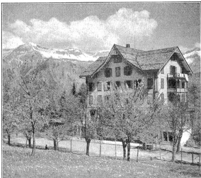
Das stadtbernerische Schülerferienheim auf Schweibenalp bei Brienz.

Die Stadtgemeinde Bern leistet viel für die geistige und körperliche Ausbildung ihrer Jugend. Sie hat unter