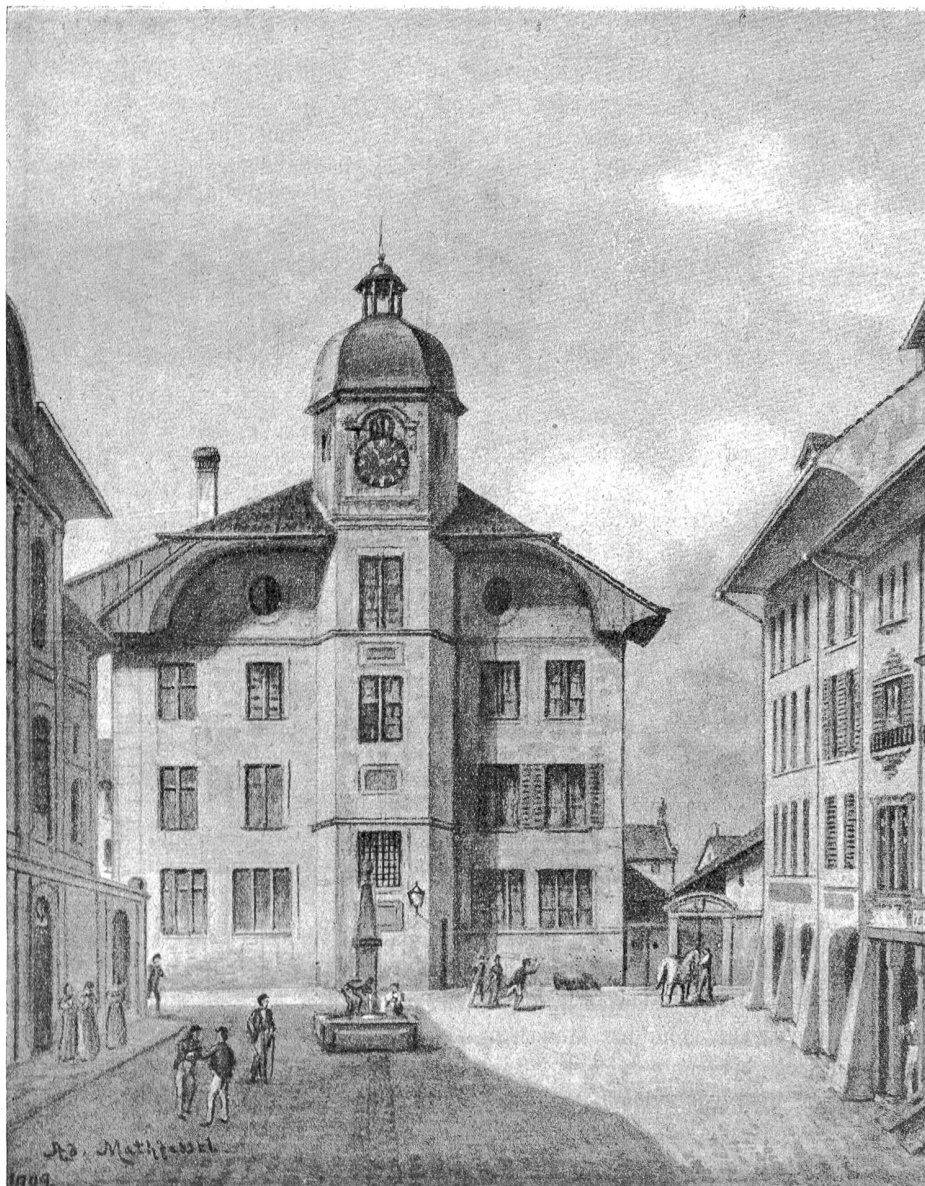
Das alte Schulhaus oben an der Herrengasse in Bern. Stand bis 1905 an der Stelle der alten Franziskanerkirche, in der 1528 das Reformationsgespräch abgehalten wurde.