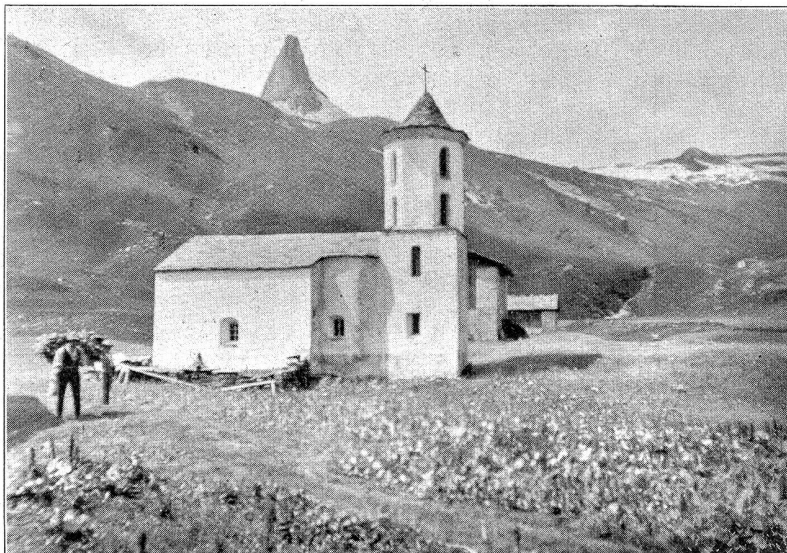
Zerfreila im Vals, 1780 Meter über Meer. Kirche mit Zerfreiler Horn.

Scheuten heutige Männer und Frauen die Arbeit in den höchsten Tälern nicht, würde der Staat diese Besiedlung tatkräftig fördern, wir glauben, aus alten Walsersiedlungen könnte noch einmal neues Leben erwachsen. Die Besiedlung der höchsten Alpentäler im Laufe der Jahr-