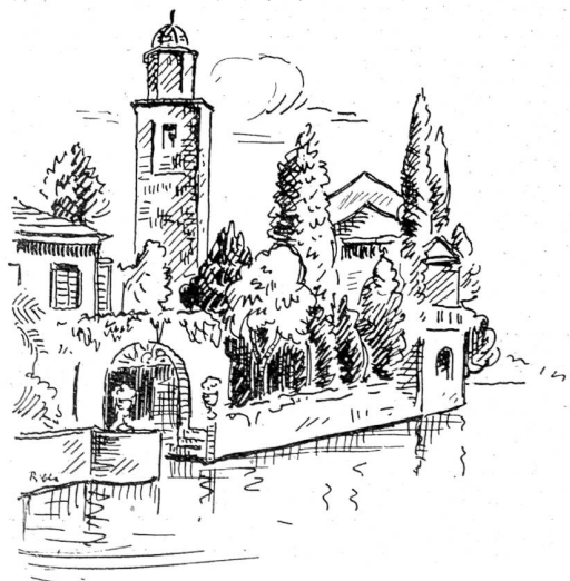
Orta. Der Campanile von San Giulio.

Auf einer alten Holzterrasse über dem See, die zum Gasthaus Leone d'Oro gehört, kann man sich Fischgerichte in einem Kranz grüner Kräuter schmecken lassen. Man er- hebt sich vom Mahl mit wallender Wärme im Gesicht; eine essigreiche Insalata, Salami oder Mortadella hatten auf den Lippen gebrannt und einem italienische Bluthitze in