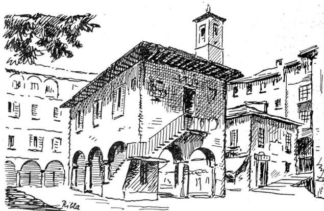
Orta. Municipio und Marktplatz am Ortasee in Oberitalien.

Auf Orta zu führt eine große weißglänzende Landstraße dem See entlang. Sie hat Erdduft an sich, man braucht sie nicht zu fliehen wie die Pest, um auf Seitenweglein Land und Luft zu suchen. Gärten, alte Gemäuer, Weinberge, Gras, Aussicht, Waschplätze grenzen an. Zu