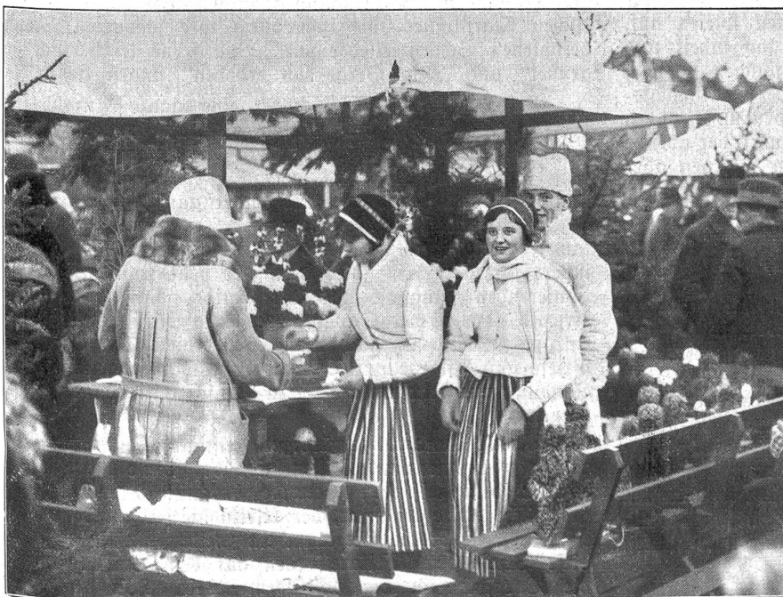
Weihnachtsmarkt in Stockholm

Das Julfest; so heißt Weihnachten, das Fest Christi Geburt, in Schweden! — ist in dem Lande der Mitternachts-sonne seit den undenklichsten Zeiten das größte Fest des Jahres. Seine Geschichte und Tradition reicht bis weit in die vorgeschichtliche und heidnische Zeit zurück, wo man noch die Wiederkehr der Sonne und das Längerwerden der Tage nach der Sonnenwende feierlichst beging. An diese Zeit erinnern besonders die Sternfänger, weißgekleidete, von Haus zu Haus ziehende, uralte deutsche Weihnachtslieder singende Knaben, mit einer Krone auf dem Kopf und Laternen in Sternform in der Hand, zu denen sich meist St. Nikolaus oder der Weihnachtsmann gesellt, der Gaben für die Armen in den Wohnungen und auf den Straßen sammelt. Ja, die Straßen. Man erkennt sie zur Weihnachtszeit gar nicht wieder. In jeder Groß- und Kleinstadt lebt sich in ihnen der traditionelle Weihnachtsmarkt