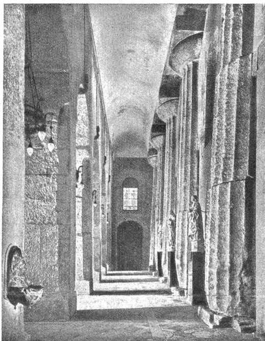
Syrakus. — Athenatempel.

Eine der berühmtesten Latomien ist die in der Achradina gelegene Latomia dei Cappuccini. Sie wird für diejenige gehalten, in der nach Thukydides 7000 kriegsgefangene Athener lange Zeit schmachten mußten, bis sie schließlich zum größten Teil in die Sklaverei verkauft wurden. Nach Entrichtung einer Lira am Haupteingang beim Kapuzinerkloster erhält man Einlaß in diese Unterwelt. Man steigt hinunter in ein wahres Labyrinth von engen, die Steinbrüche miteinander verbindenden Durchgängen. Es setzt sich zusammen aus Brücken, Bögen und Pylonen, deren einer aussieht wie der Kopf eines Krokodils. Etwa 30 Meter unter der Erdoberfläche dehnt sich da, wo einst einer der Steinbrüche lag, und wo Tausende von Sklaven mit primitivem Werkzeug Baumaterial für Syrakus herausmeißeln mußten, ein wundervoller Garten. Von den Felswänden, von deren obren Rändern Geranien und Bougainvillien wie vom blauen Himmelszelt heruntergrünen, ist nichts mehr zu sehen. Dichter Efeu überkleidet sie mit dunklem Grün,