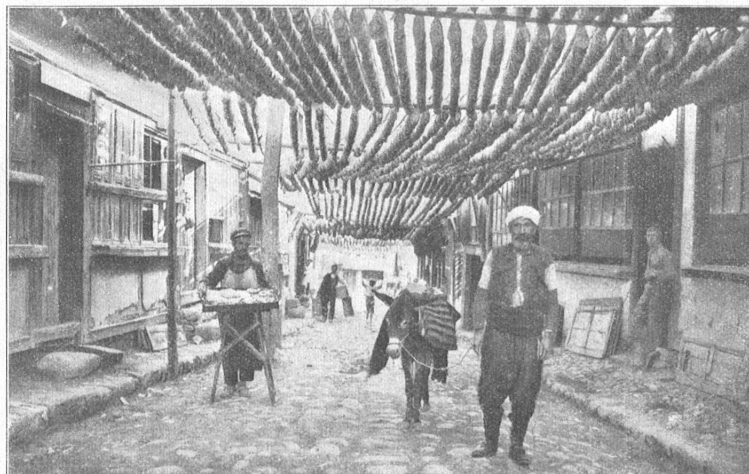
Ein Baldachin aus Tabak. — In den bulgarischen Dörfern werden zur Erntezeit die Tabakblätter aufgesädelt und an langen Stangen aufgereiht, die zum Dörren der Blätter zwischen den Häusern in die Sonne gehängt werden. Man geht in solchen Orten wie unter einem unendlichen Baldachin aus Tabak.

Alle diese Gründe haben zu einer erschütternden Armut des Landes geführt. Man muß berücksichtigen, daß das Staatsbudget für 1931/32 mit einem Betrag von 230 Millionen Goldfranken abschließt. Im Verhältnis zu der