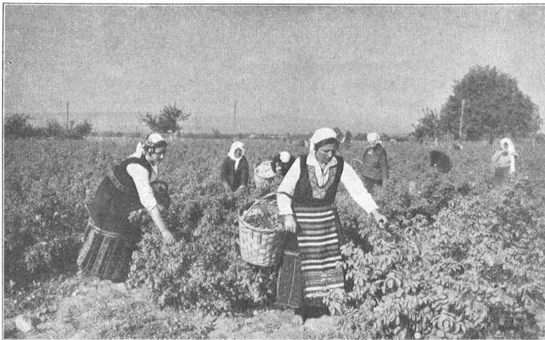
Bulgarisches Rosenöl. — Rosenblüten-Ernte in Südbulgarien. Bei Tagesanbruch beginnt man mit der Ernte. Spätestens um 9 Uhr vormittags hört man damit auf, denn je höher die Sonne steigt, desto schwächer wird der Duft der Rosen.

Jahres 77 Millionen Goldfranken, gegen 87 Millionen Goldfranken im Jahre 1931. Der gesamte Export betrug in der ersten Hälfte dieses Jahres 62 Millionen, gegen 110 Millionen Goldfranken im Jahre 1931. Die Ausfuhr ist also fast um 50 Prozent zurückgegangen, allerdings nur wertmäßig, denn mengenmäßig hat sie sich fast auf gleicher Höhe des Vorjahres erhalten. Dies illustriert am besten den katastrophalen Preissturz für die Produkte des Landes.