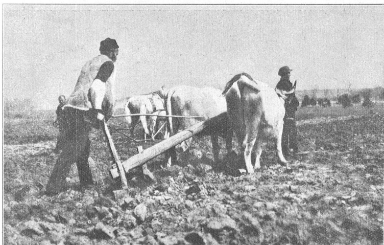
Seit 1000 Jahren die gleiche Methode! — Nach den letzten amtlichen Feststellungen gibt es in Bulgarien heute noch beinahe 460,000 dieser primitivsten Holzpflüge, während es nur ca. 300,000 eiserne Pflüge gibt.

Lichter erglänzen der Bahnstrecke nach und in den Dörfern und bringen Trost in die graue, kalte Wehmut draußen.