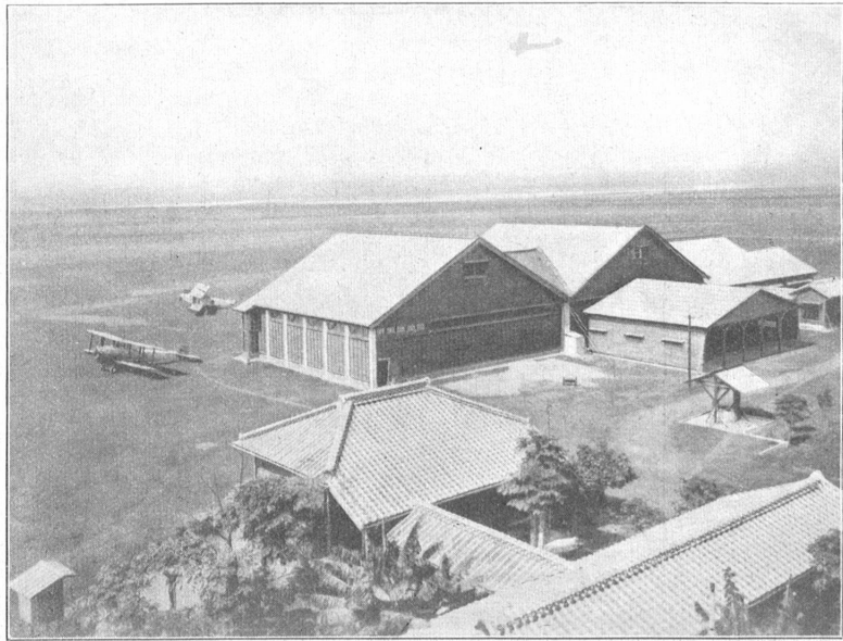
Der im Jahre 1910 von den Japanern eröffnete Flughafen in Taito, im Takao-Distrikt.

Um eine wirtschaftliche Erschließung des Landes zu ermöglichen, war es notwendig, Häfen, Straßen und Eisenbahnen zu bauen. Die Hauptbahnlinien führen von Karento nach Taito und von Keelung nach Takao. Von der letzten Strecke zweigen fünf Nebenlinien ab. Außerdem gibt es noch verschiedene Privatbahnen, die fast ausschließlich der Zudercompagnie gehören. Von den Küstenstädten führen ganz modern gebaute Straßen nach dem Innern