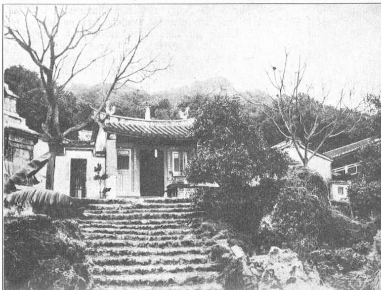
Tempel aus dem Jahre 1763 im Okayama-Distrikt, wurde von den Chinesen erbaut.