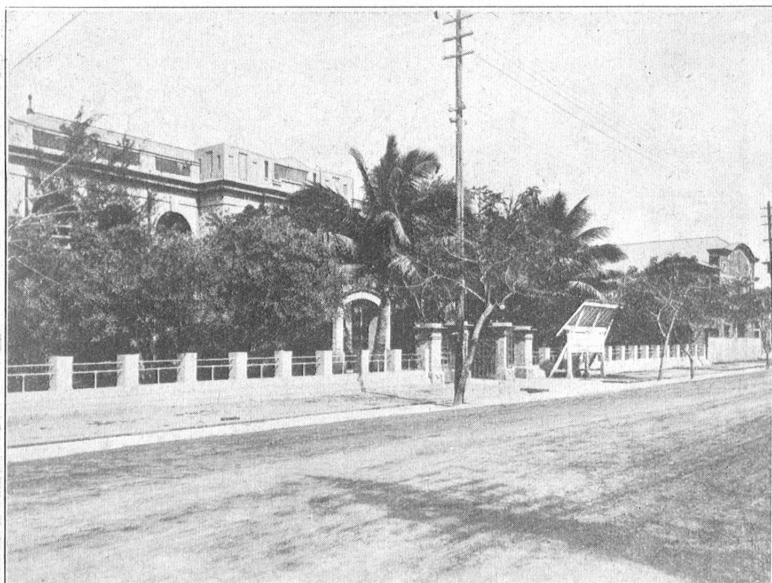
Verforgungsamt in Cacao auf Taiwan.