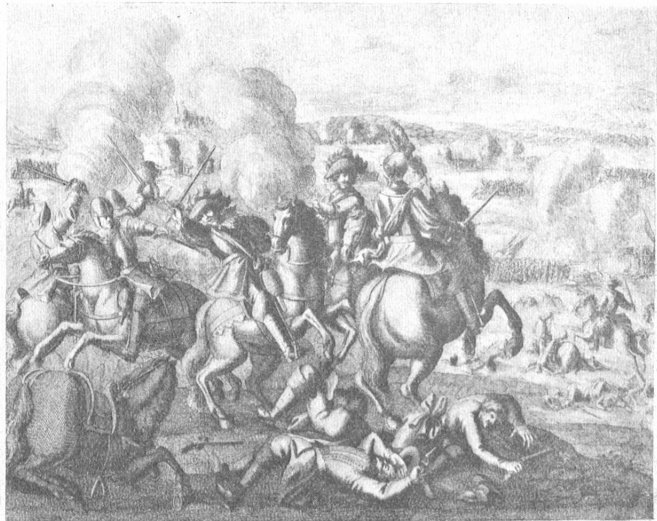
Cod Gustav Adolfs, des Königs von Schweden bei Lützen 1632.