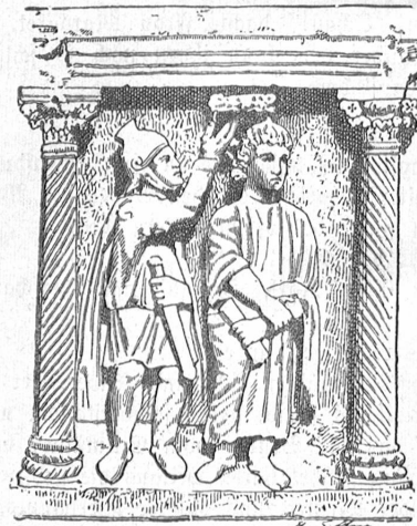
Abb. 2. Angebliche „Dornenkrönung“-Sarkophag im Lateran. Galt früher als die älteste Christusbildung.

Es kann dabei nicht auffallend sein, wenn sich die Bibel selbst über das körperliche Aussehen Christi ausschweigt,