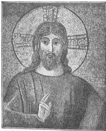
Abb. 5. Bildnisausschnitt aus dem Apfismosaik der Kirche des Lateran. 5. Jahrhundert. Sogenannter aszetischer Typus.

Die künstlerische Darstellung Jesu begann in den Kreisen der christlich gewordenen Griechen schon sehr früh; aus den Kreisen der Judenthüm ist wohl mit gleichzeitigen bildhaften Gottesdarstellungen nicht zu rechnen. Aber diese Darstellungen der griechischen christlichen Künstler waren in künstlerischem Sinne griechisch-konventionell und zwar nach dem Vorbild der griechischen Philosophenbilder geformt und hatten, wie aus den Schriften des Kirchenvaters Eusebius deutlich hervorgeht, keinen Porträtcharakter. (Eusebius gest. 379 n. Chr. beschäftigt sich sehr eingehend mit diesen „heidnischen“ Christusdarstellungen.)