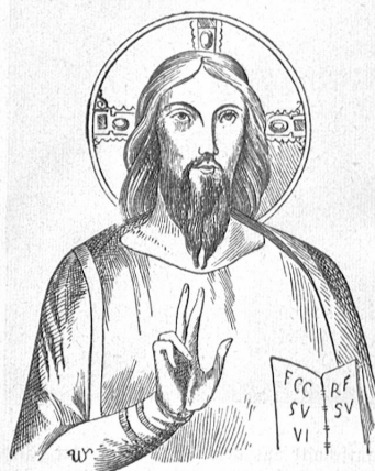
Abb. 7. Christuskopf aus S. Gaudio in Neapel, edler, hagerer, aber wirklichkeitsgetreuer Christustyp.