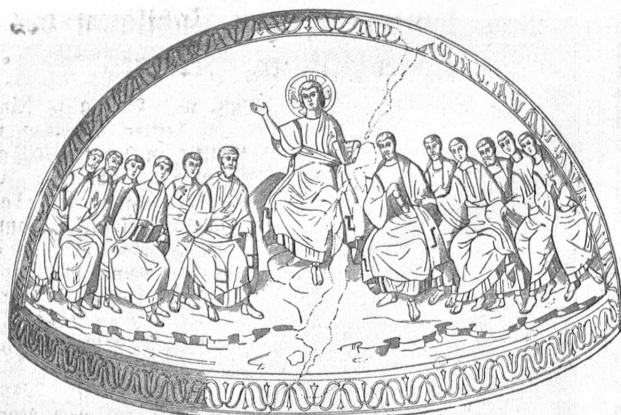
Abb. 3. Christus und die Jünger, Mosaik in S. Aquilino in Mailand. Jugendlicher Christustyp.

mischen Kunstkreis geschaffene Christusdarstellung wäre die der „Dornenkrönung“ auf einem frühchristlichen Sarkophage im Lateranmuseum zu verstehen, wenn — die Bezeichnung „Dornenkrönung“ für das Werk zu recht besteht und es sich nicht um einen heidnischen, erst später christlicher Bestattung zu Diensten gemachten Sarkophag handelt, was wahrscheinlicher sein dürfte. (Abb. 2.)