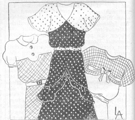
Eine in Farbe oder Material abweichende Pässe verlängert und macht auch das einfachste Kleid modern. (Nr. 3)

Von den vielen Möglichkeiten, die zur Zeit sehr moderne Pässe anzulegen, geben die Zeichnungen Nr. 3 ein anschauliches Bild. Wir haben auf diese Weise Gelegenheit für wenig Geld unsere Garderobe zu modernisieren und genießen dabei die Freude der eigenen Arbeit. Machen wir einen Versuch!