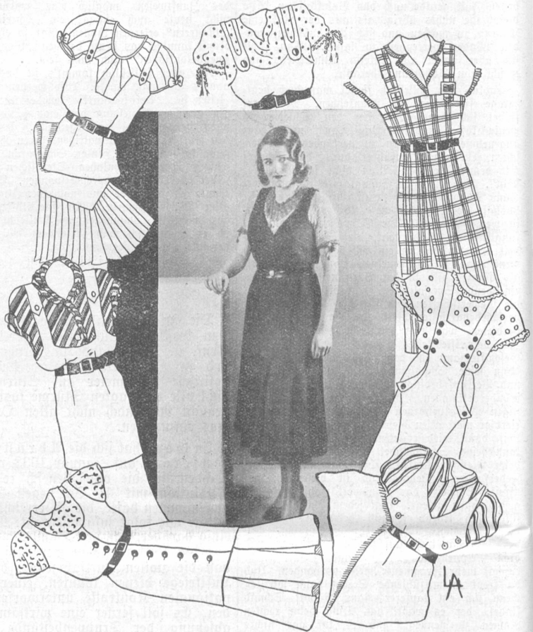
Mannigfache Formen eines Leibchen- oder Trägerrocks. (Nr. 1)

Steht uns nun aber der hierzu notwendige halbe Meter Neustoff nicht zur Verfügung oder ist das Kleid auch unter den Armen stark vertragen, so machen wir daraus den jetzt so modernen Leibchen- oder Trägerrock (Nr. 1). Voraussetzung hierfür ist, daß das Oberteil des Kleides bis zur Hälfte in einem Stück geschnitten ist. Die Ärmel werden so tief herausgeschnitten, daß alle schlechten Stellen wegfallen und die Schulternnaht wird aufgetrennt. Ein leichtes Blüschchen findet sich im Vorrat oder wird Wollspitzenstoff mit kurzen, eingelehten Ärmelchen hergestellt. Nun zieht man das aufgeschnittene alte Kleid darüber,