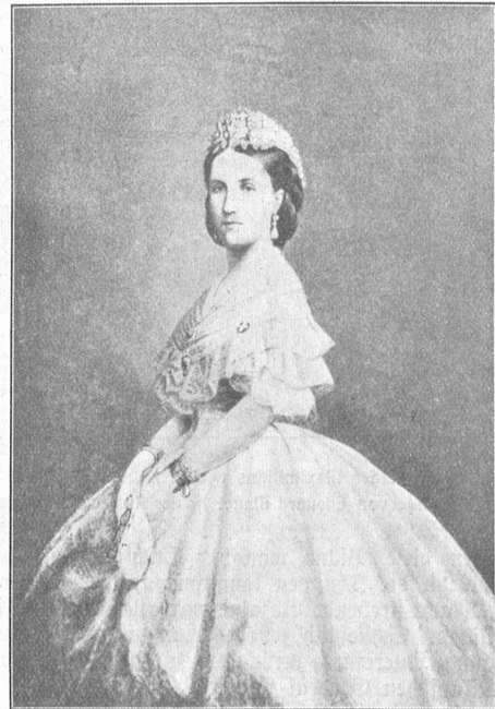
Kaiserin Charlotte von Mexiko.

heute in Schanghai) die Interessen der Fremden gegen die Gefahren der chaotischen Zustände im Lande zu schützen, da ahnte bereits das französische Volk und mit ihm die