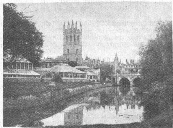
Botanischer Garten im Magdalen-College in Oxford.

In seinem schönen Hof steht eine alte Kanzel aus dem 15. Jahrhundert, wo in früheren Zeiten bei besondern Anlässen Predigten unter freiem Himmel abgehalten wurden.