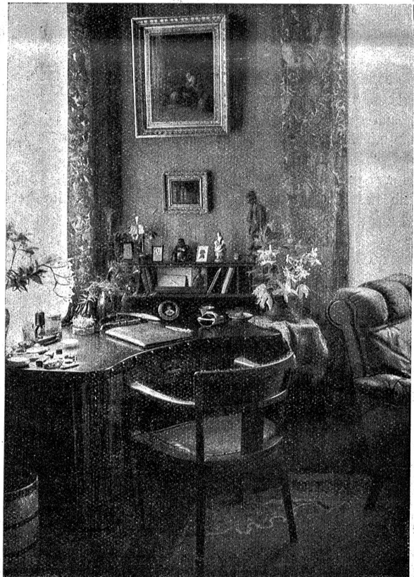
Schreibplatz eines Sammlers. Die exotischen Formen der verwendeten Blumen passen gut zu den ostasiatischen Sammelgegenständen und geben dem Raum und seiner gegenständlichen Zier den letzten Schliff.

Die ruhigen, breiten Flächen des modernen Raumes bilden Hintergründe, die nicht mehr, wie früher, wir unter-