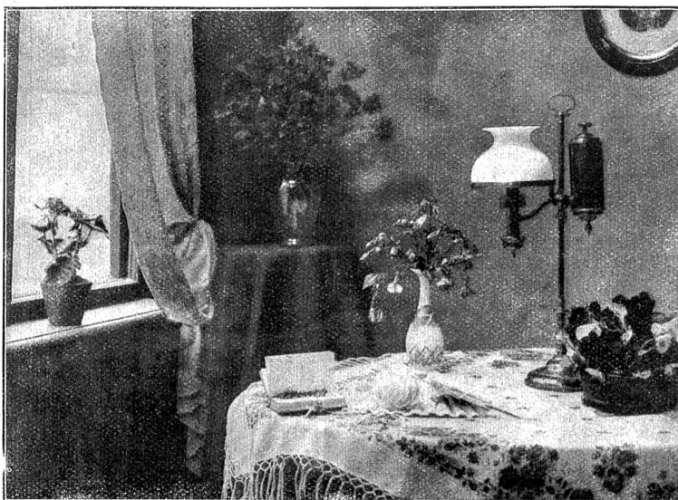
Einfaches Zimmer in einem entlegenen Landhaus. Man denke sich den Blumenschmuck einmal weggenommen und wird dann erst bemerken, welchen hohen Schmuck- und Wohnwert Blumen besitzen.

So offenbart sich uns mit einem Male wieder der tiefere Sinn des Blumenschmuckes im Raum überhaupt, seit wir ihn gelöst haben von der Funktion des gezwungenen Stils, des erzwungenen Dekorativen, seit die