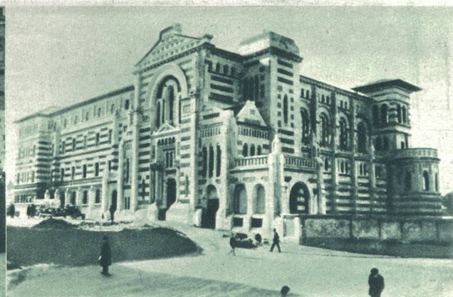
Zur Auswanderung der Jesuiten aus Spanien. Das Kloster von Notre-Dame de Begona in Indaicho, Bilbao, eines der von der neuen spanischen Regierung enteigneten Besitztümer des Jesuitenordens.