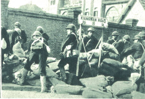
Links: Chinesen in den Schützengraben von Tschapel, in welchen sie mit äußerster Zähigkeit den japanischen Sturmangriffen standhielten. Rechts: Japanische Infanterie in Shanghai errichtet Barrikaden aus Sandsäcken an der Straße nach Kiangwan, einem vielumkämpften Chinesendorf.