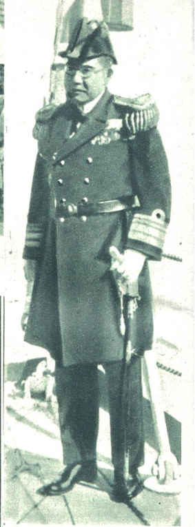
Nomura, der Kommandant der japanischen Streitkräfte, in voller Uniform.