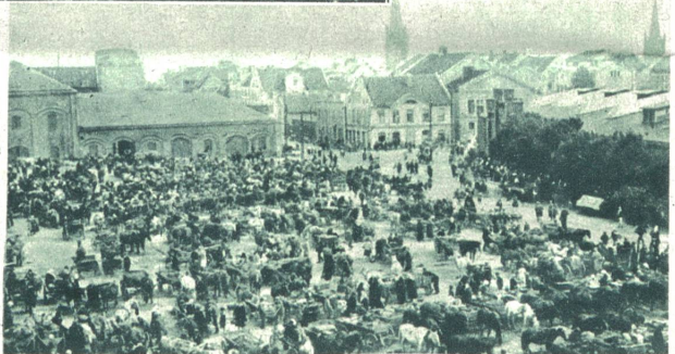
Der Markt im Städtchen Memel, dessen deutscher Landespräsident von der litauischen Regierung abgesetzt und verhaftet wurde, welcher „Staatsstreich“ von den Deutschen vor den Völkerbundsrat gebracht wurde und von diesem gern auf den Gerichtshof in Haag abgewälzt würde, weil sich die Völkerbundsratsherren schon mit dem chinesisch-japan. Konflikt nicht zurechtfinden.

Das Rechtsministerium Laval wurde vom Senat gestürzt, damit es einem Koalitionskabinet Platz mache. Painlevé hat kein solches zustande gebracht. Nun hat Tardieu an Stelle des Ministeriums Laval - Tardieu ein solches Tardieu-Laval gesetzt. Das neue Ganzrechts-Ministerium soll nun wenigstens noch den kurzen Rest der Wahlperiode „halten“.