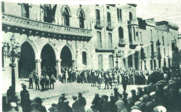
Neue Revolten in Spanien. Die Volksmenge vor dem Stadthaus in Tarassa, welches von den Kommunisten erstürmt worden war und nach hartem Kampf wieder von der Zivilgarde erobert werden konnte.