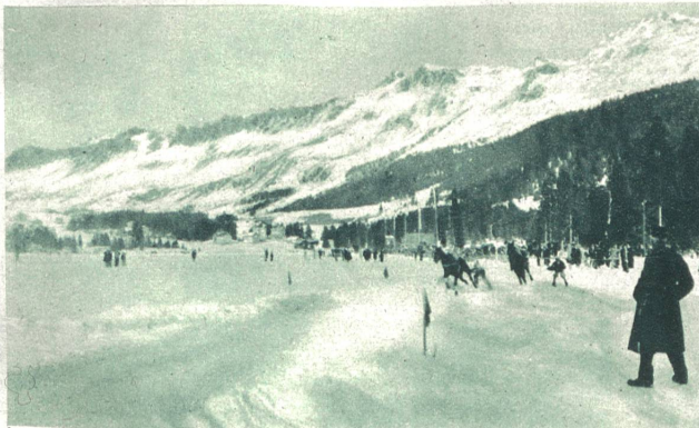
Pferderennen auf dem Lenzerheide-See.