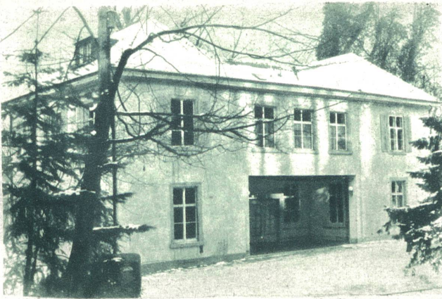
Das Parkhaus St. Margarethen in Basel, welches das neue Studio des Radio Basel beherbergt.