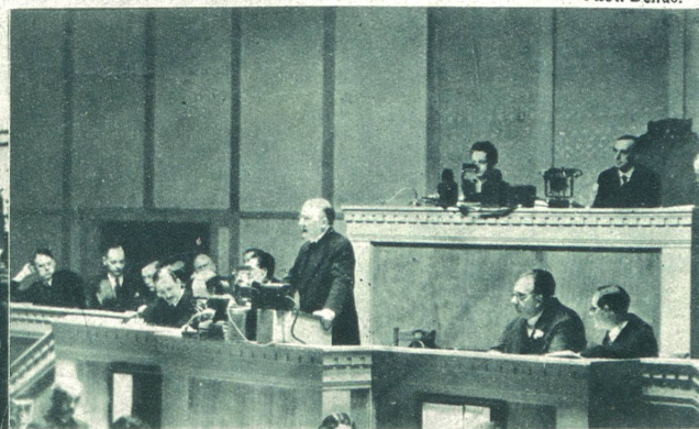
Der deutsche Reichskanzler Dr. Brüning spricht an der Abrüstungskonferenz in Genf.