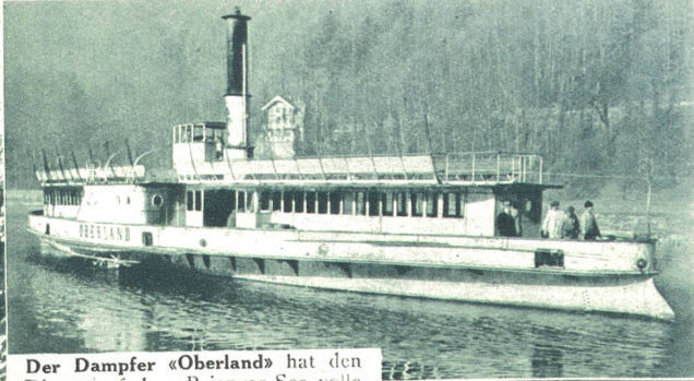
Der Dampfer «Oberland» hat den Dienst auf dem Brienzer-See volle 60 Jahre versehen und wurde letz- thin auf Abbruch verkauft.