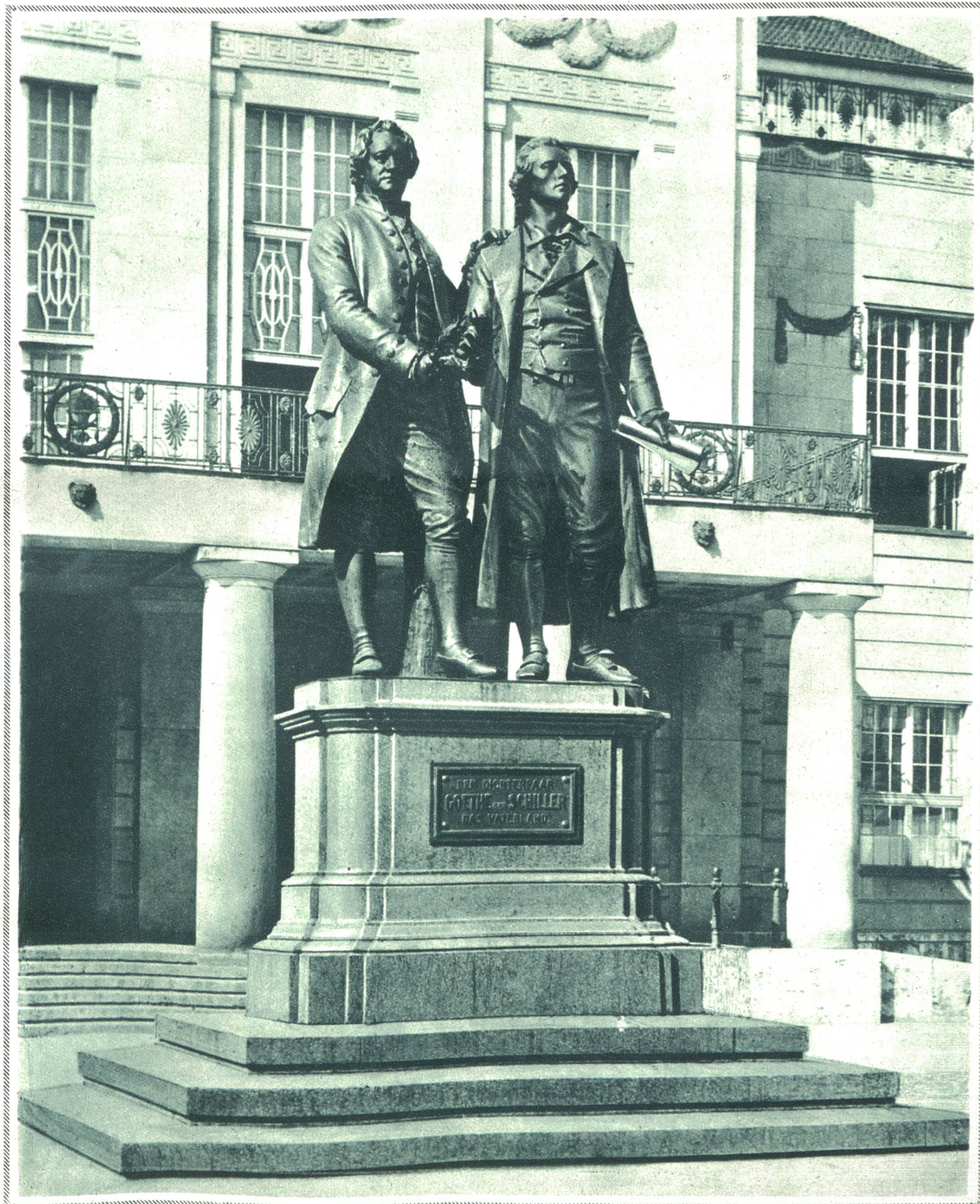
Zum 100. Todestag (22. März 1832) des größten deutschen Dichters Wolfgang von Goethe. Das Denkmal der beiden deutschen Dichterfürsten Goethe und Schiller vor dem Nationaltheater in Weimar.