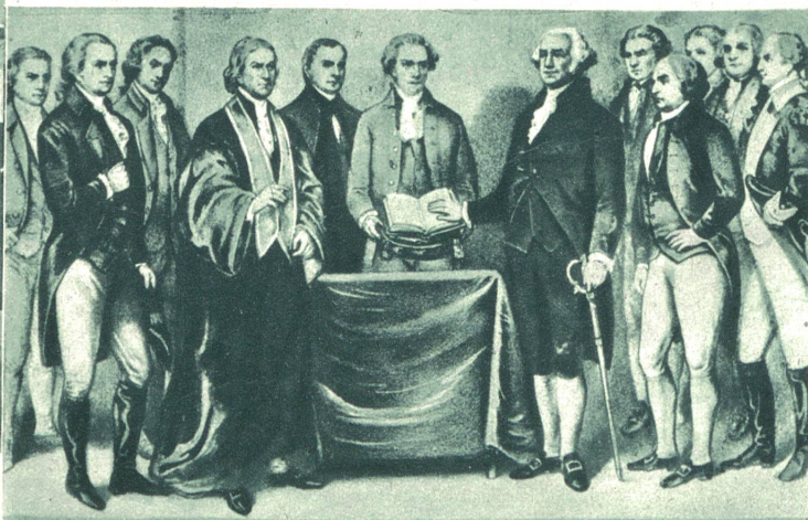
Die Veredlung George Washingtons als erster Präsident der Vereinigten Staaten von Nordamerika. Am 22. Februar 1932 wurden in ganz Amerika große Feiern zu Ehren des 200. Geburtstages des amerikanischen Nationalhelden George Washington veranstaltet. Washington war Oberbefehlshaber im Freiheitskrieg der amerikanischen Kolonien gegen England und wurde im Jahre 1789 der erste Präsident der Vereinigten Staaten. Unser Bild zeigt Washington (mit dem Degen), neben ihm (rechts) John Adams, späterer Präsident der U. S. A.