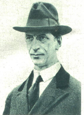
De Valera der künftige Präsident des Irischen Freistaates. Er war im Aufstand der Irländer gegen Englands Herrschaft einer der erbittertesten Führer der Gegner Englands und entging knapp der standrechtlichen Hinrichtung.