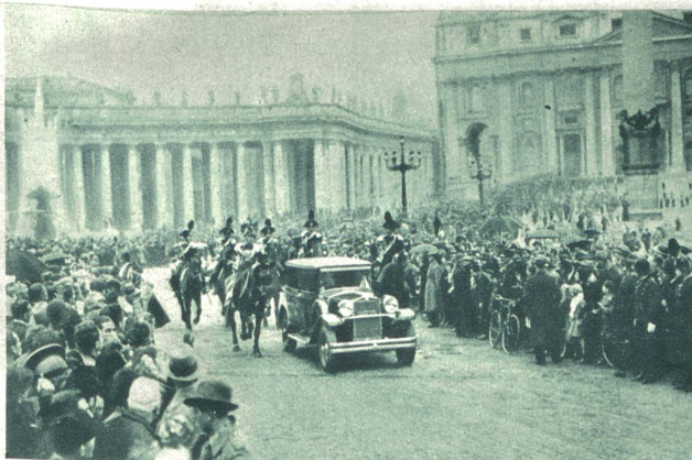
Rückkehr Mussolinis nach dem Empfang beim Papst, der aus Anlaß des zehnjährigen Amtsjubiläums von Papst Pius XI. mit großer Feierlichkeit erfolgte. Die Automobile sind von Carabinieri begleitet. Im Hintergrund die Kolonnaden, welche zum Aufgang in die Peterskirche führen.