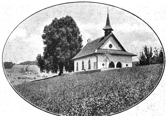
Kapelle bei Heiligenschwendli.

Wie bedaure ich, daß Du einen Rückfall erlitten hast und Deine Reise hinauschieben mußt! Das Zimmer steht für Dich bereit: ein sonniges Einzelzimmer im Neubau, mit einem Balkon, auf dem Du auf bequemem Liegestuhl die warme Februarsonne genießen kannst; mit fließendem Wasser, kalt und warm, sogar mit Telephon oder Radio, wenn Du es wünschst. Die Haltenegg hat sich eben mit dem im letzten Jahr entstandenen Neubau (siehe Bild Seite 132) ganz den modernen Ansprüchen angepaßt. Der Lift erspart Dir das Treppensteigen, Radio und Grammophon und eine ganz vorzügliche Bibliothek unterhalten Dich.