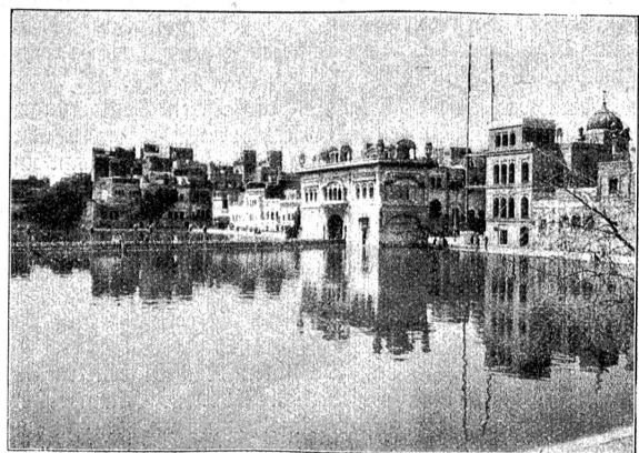
Aus Indien. — Amritsar. Der Eingang zum goldenen Tempel.

Herrscht aber auf einer Seite ein Reichtum, wie wir ihn kaum ausdenken können, so herrscht anderseits in dem Riesenreiche eine Armut, von der wir noch weniger Vorstellungen haben. Elend, Not, Armut wie sie die sonstige Welt nicht kennt, trotzdem die Inder nach dem Zeugnisse Ramsay Macdonalds das fleißigste Volk der Welt sind. Mehr als die Hälfte der Bauern, und das sind über 100 Millionen Menschen, die in 700,000 Dörfern leben, können sich das ganze Jahr an keinem einzigen Tage sattessen, sie leben mitten drin in den reichsten Baumwollplantagen und haben kaum einen Lumpen, um sich zu bekleiden. Von den Wohnungen gar nicht zu sprechen, von denen wir uns überhaupt keine Vorstellung machen können. Ist die Wohnung der Bauern schon eine elende Lehmhütte, die nach jeder Regenzeit zusammenfällt, so sind dies immerhin noch