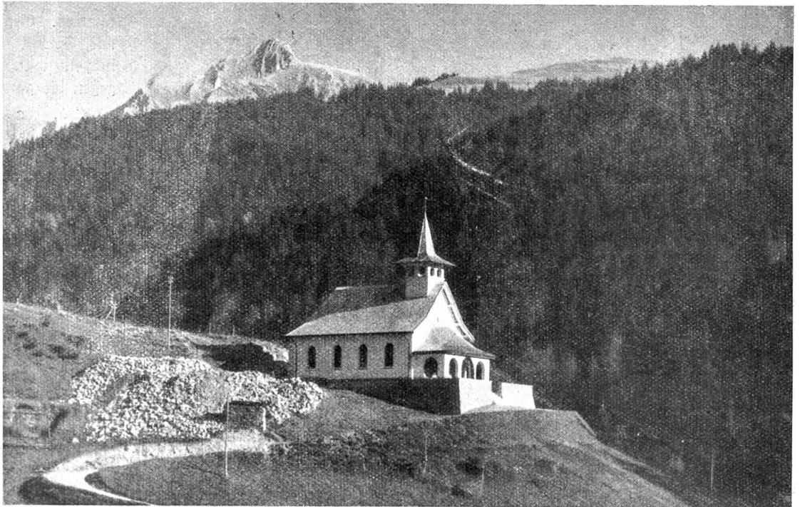
Das Bergkirchlein in Sangernboden (Gemeinde Guagsberg), das am 18. Oktober 1931 eingeweiht wurde. Erbauer des Kirchleins ist Architekt Dachzelt.

„Du bist ein Kalb“, stellt Jakob Stodauer zum zweiten Male fest, aber diesmal mit weniger Nachdruck. Er sieht