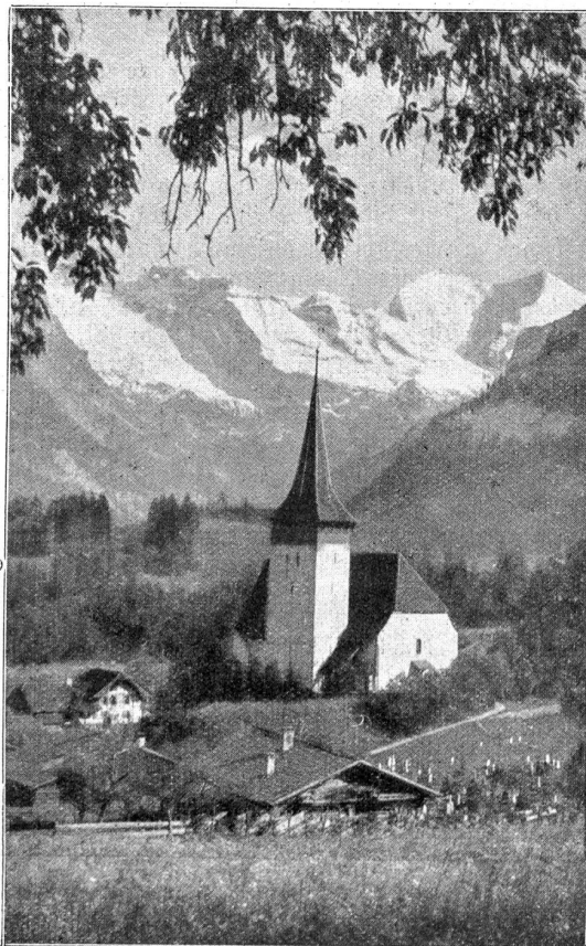
Die Kirche von Sritigen.

die Kräuter, kochte ihre Tränklein, klebte ihre Pflaster und — was vielleicht oft das Beste von allen war — legte ihre braven, braunen Hände dem Kranken auf Kopf und Leib und sang ihnen bisweilen eins ihrer frischen Lieder vor.