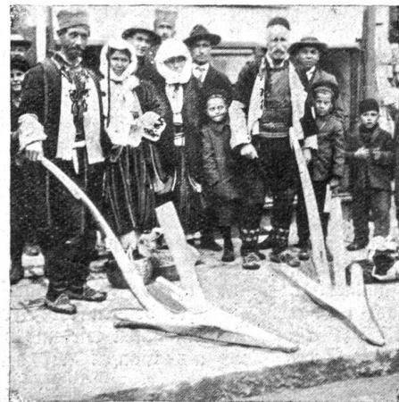
Serbische Bauern mit alten Holzpflügen.

In diesen jungserbischen Kreisen arbeitet stark der Protestantismus. In Saloniki saßen vor Jahresfrist die Ber-