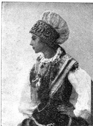
Hochzeitstracht der Slowenin.

baren Plan gegenseitiger Zusammenarbeit. Hier ist die orthodoxe Basis noch respektiert. Es gibt aber auch prote-