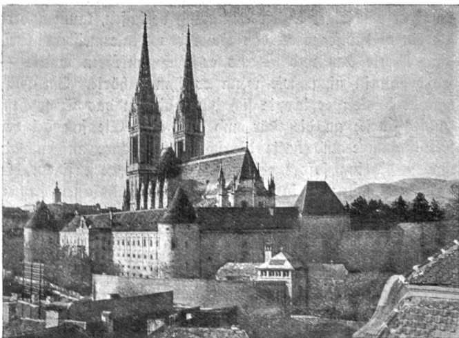
Zagreb. Blick auf den Dom.

Jugoslawien war noch vor wenig Jahren ein Land, von dem die meisten Schweizer nur undeutliche Vorstellungen hatten. Heute organisiert sogar der Bildungsausschuß der