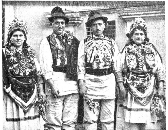
Kroatische Bauern im Festkleid.

Zürcher Sozialdemokratischen Partei 14tägige Fahrten nach Südbalmazien. Dies zeigt am besten den Umschwung der Lage. Auch das sogenannte Proletariat, nicht mehr nur feudale Herrschaften, lernen etwas kennen von der Wunderwelt der Adriaküste.