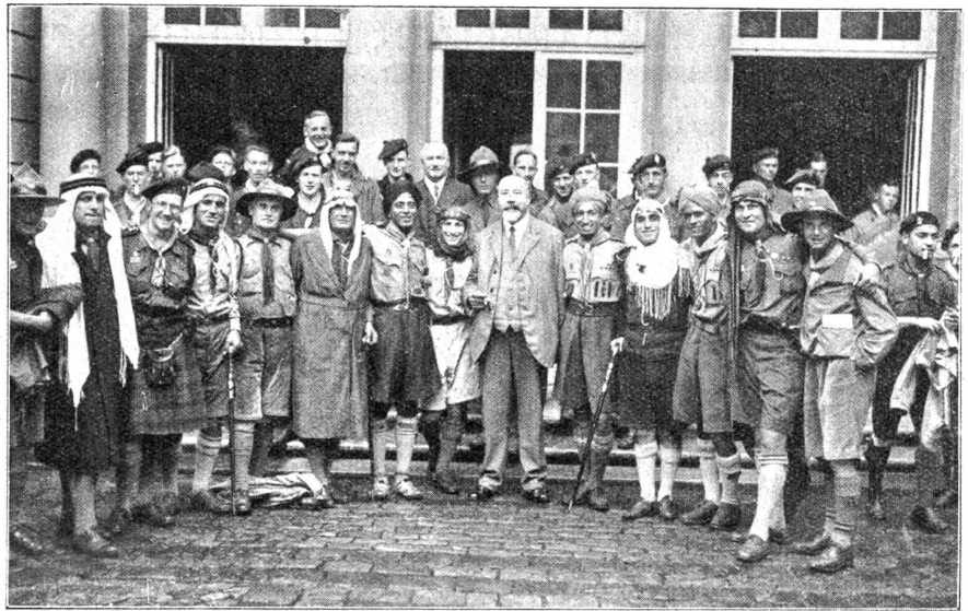
Vom Besuch der Rover-Scouts in der Bundesstadt. Nach der Begrüßung durch Stadtpräsident Lindt vor dem Erlacherhof.

In den Bergen. Am 6. ds. vor-mittags stürzten während eines heftigen Gewitters beim Abstieg vom Gipfel des