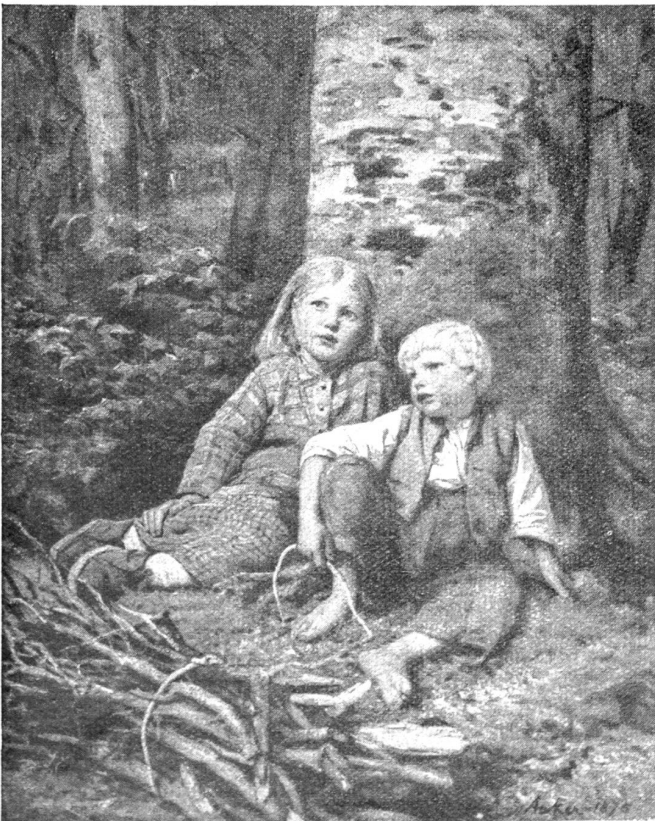
Albert Anker. — Reisigsucher.

Die Hyspa ist nun schon die 4. große Ausstellung auf dem Neufeld-Bierfeld, dem klassischen Ausstellungsgelände Berns. Sie umfaßt mit den auf dem Neufeld (siehe Plan-fizze S. 404) gelegenen Sportplätzen ungefähr das Areal der