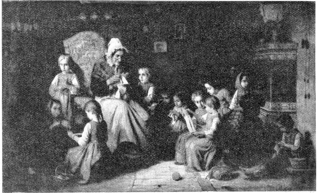
Albert Anker. — Die Nähstube.