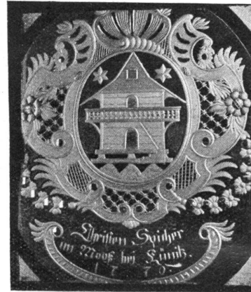
Geschliffene Scheibe aus einem Bauernhaus von Herzwil.

Schienenstrang, Puls der Welt, du aber hast Herzwil unberührt gelassen. Abseits der großen Heerstraßen liegt es, wohl für immer, in mancherlei sich selbst genügend, lächelnd in behäbiger Zufriedenheit. Ist's ein Nachteil?