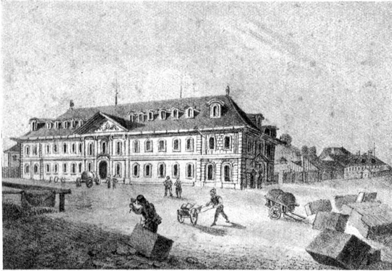
Der ehemalige Artillerieschopf (Kavalleriekaserne) als Kaufhaus (Douane) um 1840. (Schweiz. Landesbibliothek)