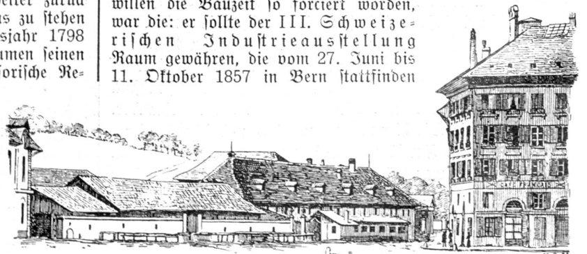
Das alte Schellenwerk und die Kavalleriestallungen 1856. Aus „Bern, Bilder aus Vergangenheit und Gegenwart“ (1896).

Die erste Zweckbestimmung des Neubaus, um deren willen die Bauzeit so forciert worden, war die: er sollte der III. Schweizerischen Industrieausstellung Raum gewähren, die vom 27. Juni bis 11. Oktober 1857 in Bern stattfinden