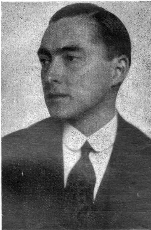
R. N. Coudenhove-Kalergi, der Gründer der Paneuropa-Bewegung.

bereit ist, zu kontrollieren und ihre Karten abzudecken. Die Völker würden so ihre wahren Feinde kennen lernen und würden sich nicht mehr verheizen lassen. Die Abrüstung kann nur in einer entgifteten politischen Atmosphäre vollzogen werden.