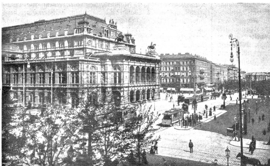
Wien. — Kärntnerring mit Oper.

Und sagen die Deutschen: „Jeder einmal in Berlin!“, so dürfen die Oesterreicher auch ruhig sagen: „Jeder mindestens einmal in Wien!“. Als ich im März nun da war, hielt gerade der Riesenverband der osteuropäischen Krähen auf der Wiener Hofburg, will sagen davor, einen krächzenden Kongreß ab. Gar zu drollige Kerls! — Wie schade, daß ich selber nur zwei Tage bleiben durfte. Es war aber auch wieder bei schönem Wetter ein herrlicher Flug zurück! „Hallo, sag' mal“, frug ich in Zürich, „ich habe dir einen Brief Mittwoch Abend Bahnpost, einen zweiten Donnerstag Abend Flugpost geschickt, wann erzieltest du sie?“ „Beide Freitag Abend gleicher Zeit.“ Und Porto nicht einmal das Doppelte. — Saperlot, wenn doch die eminente Bedeutung des Raschverkehrs — 7½ Stunden Genf-Wien — eilantant hervortritt, die absolute Sicherheit des Flugverkehrs durch die Unfallslosigkeit illustriert ist,