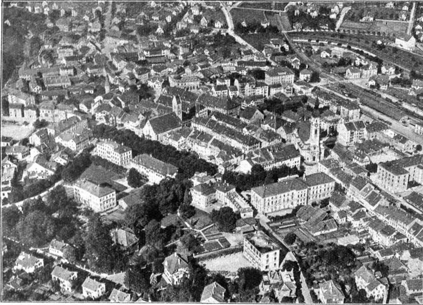
100 Meter über Frauenfeld.