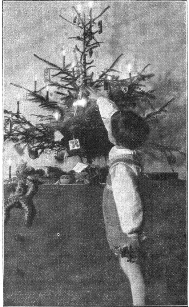
Ein kleiner Mensch — ein kleiner Baum — eine große Freude.