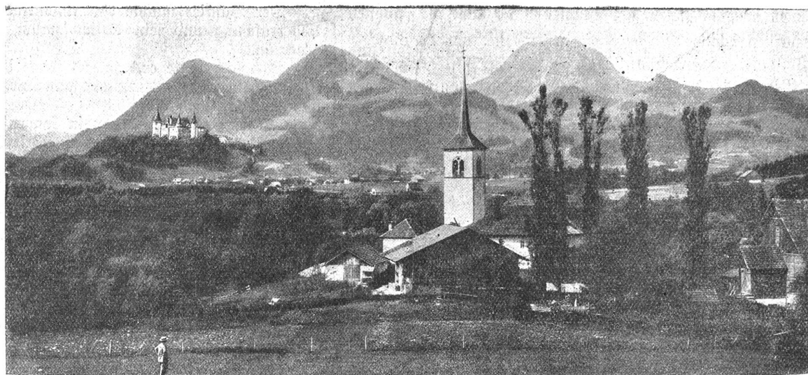
Das Schloß Greyerz von Broc aus.

Bäume rauschen leis, weiße Wolken segeln nach Osten, und einsam träumt ein Hirtenmädchen hinaus in den er- wachenden Tag. Sie lehnt im Fen- ster — von fern grüßen die Dächer ihres Heimat- dorfes, verhallend bringt Glocken- klang in ihre Ke- menate. Sie ge- denkt des Tages, an dem Graf Jo- hann III. von Greyerz in einen brokatenen Man- tel gekleidet, die wallende, weiße Feder am Barett,