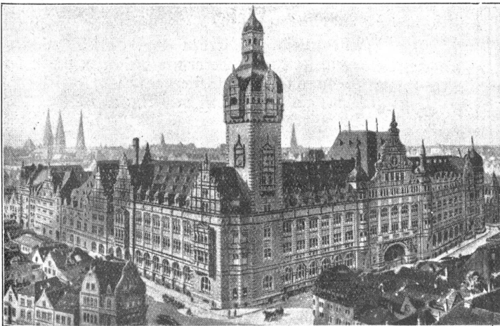
Bremen. — Lloydgebäude.

In jedem Menschen besteht das Bedürfnis nach Zärtlichkeit — das heißt nach Körpernähe und Körperwärme einer zweiten Person — als Erinnerungsrest aus der Zeit vor der Geburt und des Säuglingsstadiums, wo Stillung des Nahrungsbedürfnisses und Luftbefriedigung noch in eins zusammenfielen. In einer spätern Periode (ungefähr vom 1. Lebensjahr an) gesellt sich diesem Bedürfnis auch der Wunsch nach Beachtung, der vorerst keine andern, als die körperlichen Ausdrucksmittel kennt. Er äußert sich, je nach Anlage, aktiv oder passiv, ist aber auch dort, wo es scheinbar fehlt, im Keim vorgebildet und latent fast immer vorhanden. Am stärksten wirkt es sich im Kindesalter aus — analog dazu lassen sich auch junge Tiere gerne streicheln und hätscheln, was ihrem instinktiven Wärmeverlangen entgegenkommt —; wird während und nach der Pubertät durch erotische Wünsche abgelöst und ersetzt, stumpft sich im spätern Leben mehr oder weniger ab und erfährt erst wieder im Alter eine gewisse Reaktivität, allerdings mit sehr geringer Aussicht auf Befriedigung.