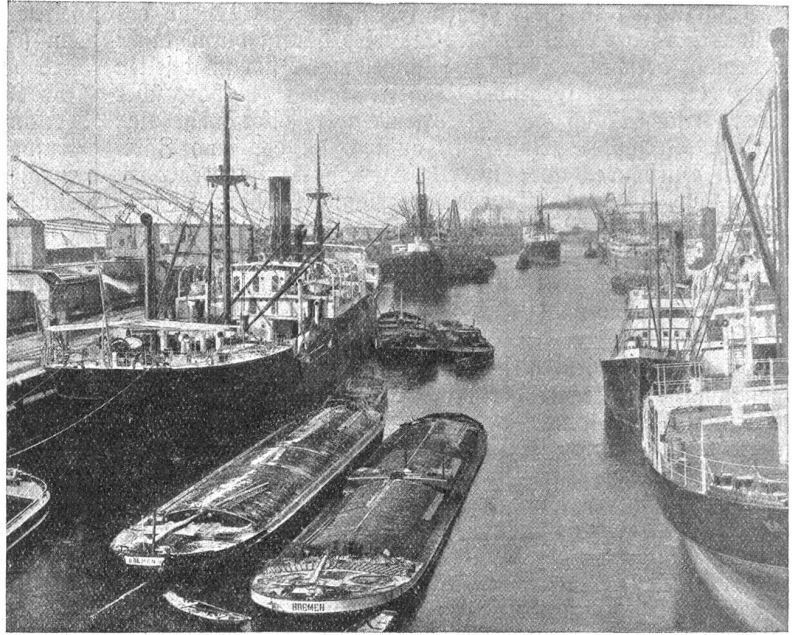
Bremen. — Sreihafen.

Wie sie selbst ihren Bewohnern durch die freundlichen gärtnerischen Anlagen des Walls, der als Ueberrest der alten Stadtbefestigung wie ein grüner Gürtel den ältesten Stadtteil umschließt, oder durch den prachtvollen Bürgerpark Erholung und Erquickung gewährt, so mag sie auch mit den wechselvollen Bildern ihrer Gegensätzlichkeit immer wieder neu und anziehend auf den Fremden wirken. Reich an wertvollen Sammlungen sind die Museen; kostbar die Kunstgegenstände, die die Stadt ihr eigen nennt. Beachtlich und anerkannt ist die bremische Bühnenkunst und erfreulich vielseitig und genussreich das Musikleben der Handelsmetropole. Auch Spiel und Sport finden in den Mauern dieser Stadt ihre Pflegestätte. Ein hochmodernes Stadion auf dem Peterswerder steht für diesen Zweck zur Verfügung. Ein an Bedeutung zunehmender Flughafen bietet die Voraussetzungen für eine wirkungsvolle Förderung des jüngsten aller Verkehrsmittel: der Fliegerei! Und wer in der Absicht der Stadt am Weserstrom entgegenreist, um auf der Fahrt durch die niederdeutsche Tiefebene die herbe Schönheit von Heide und Moor zu genießen, der findet in ihrer nächsten Umgebung die Eigenart dieser Landschaft